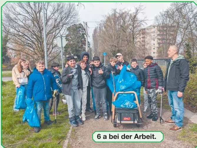
6 a bei der Arbeit.