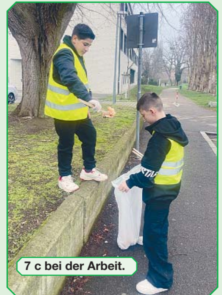
7 c bei der Arbeit.

Gemeinsam und mit Verantwortung für ein sauberes Freiburg mit einem lebenswerten Stadtteilquartier Freiburg-Haslach. Wir machen mit! Die Schüler*innen der Pestalozzi-