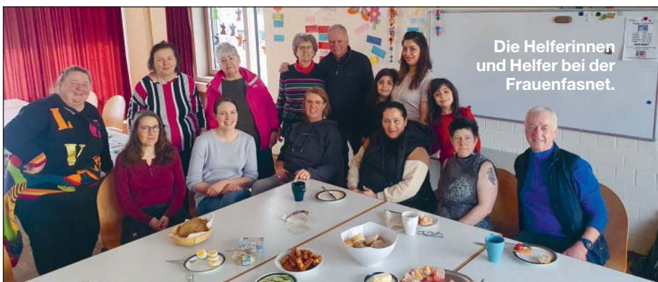
Die Helferinnen und Helfer bei der Frauenfasnet.