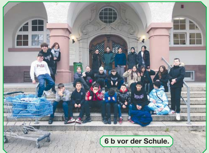
6 b vor der Schule.