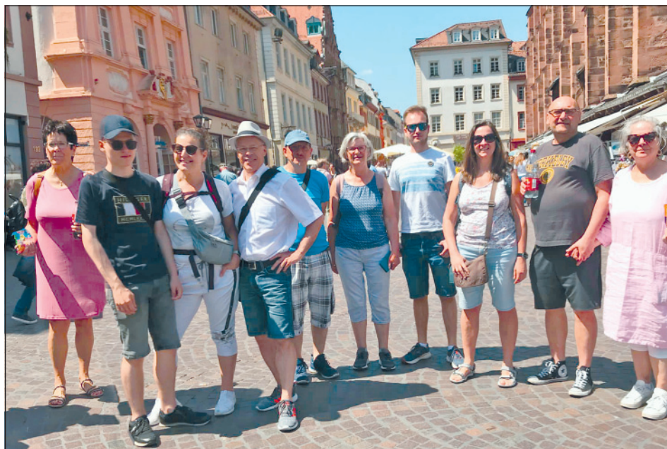
Reise des Frauen- und Männerkreises von Melancthon nach Heidelberg.