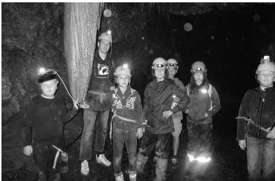
Auch in eine Tropfsteinhöhle verschlug es die jungen Haslemer während ihrer Ferienaktionen.

Am Sonntag, 15. November, öffnet der Treff seine Türen für kleine und große Haslacher. Von 14 bis ca. 18 Uhr gibt es viele kurzweilige Spiele, Back-, Mal- und Bastelangebote und Informationen sowie Kuchen, Waffeln