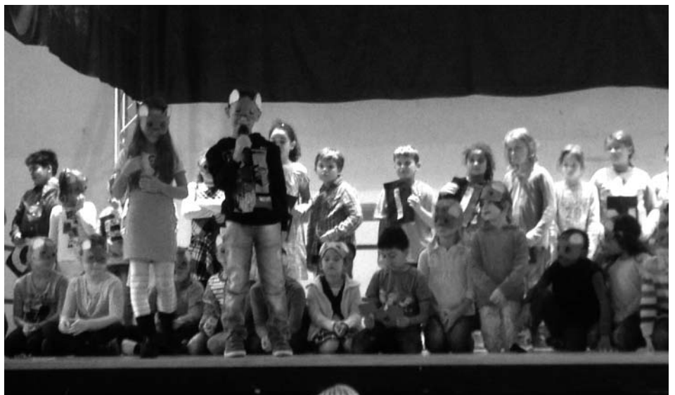
Die neuen Erstklässler sind da!