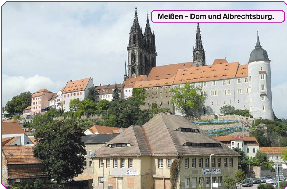
Meißen – Dom und Albrechtsburg.

die älteste und größte noch erhaltene Silbermann-Orgel von 1714, die wir im Rahmen einer Domführung auch erklingen hörten, ein musikalischer Hochgenuss. Im Schloss Freudenstein beeindruckte die „terra mineralia“ mit über 3.500 Mineralien und Edelsteinen eine der größten Mineralienausstellungen der Welt. Es ist unglaublich, welche Vielfalt von Farben und Formen wir dort zu sehen bekamen.