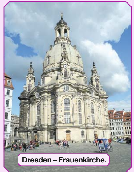
Dresden – Frauenkirche.

Aus den Friedensgebeten in der Leipziger Nikolaikirche entwickelten sich die Montagsdemonstrationen, die mit ihrem Ruf „Wir sind das Volk“ entscheidenden Anteil