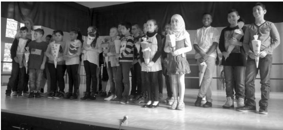
Frau Trabitczsch mit ihrer neuen 5b.