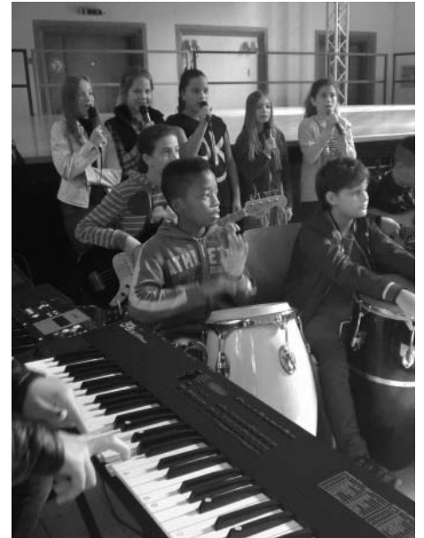
Sechstklässler gestalten die musikalische Begrüßung.