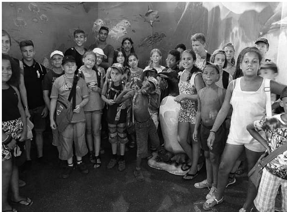
Dank Spenden konnten die Mädchen und Jungs auf der Sommerfreizeit auch das Sea Life in Konstanz besuchen.