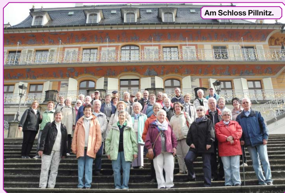
Am Schloss Pillnitz.

am Untergang der DDR hatten. Bei Goethe lockt Mephisto den Doktor Faust in „Auerbachs Keller“ und lässt ihn auf einem Fass reiten. Wir fanden auch ohne diese Verlockung dorthin und ließen uns ein schmackhaftes Essen servieren. Ein ganz anderes Bild bietet die kleine Bergbaustadt Freiberg im Erzgebirge. Bekanntestes Bauwerk ist der spätgotische Dom mit seiner romanischen „Goldenen Pforte“, dem ältesten deutschen Figurenportal. Außerdem bewunderten wir die freistehende Tulpenkanzel und daneben die Bergmannskanzel sowie