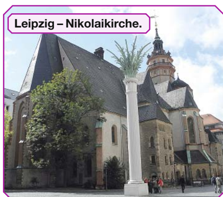
Leipzig – Nikolaikirche.