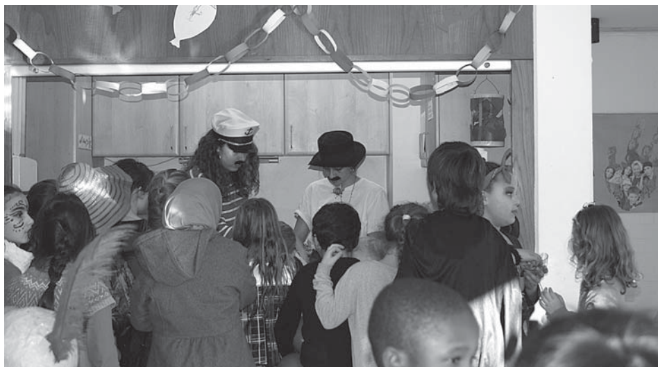
Einen Tag vor Faschingsbeginn ging es im Kinder- und Jugendzentrum schon ziemlich närrisch zu.

Seit Ende letzten Jahres gibt es im Kinder- und Jugendzentrum immer mittwochs von 16.00 bis 17.30 Uhr unser Elternkaffee. Wir möchten mit Ihnen ins Gespräch kommen, in erster Linie richtet sich das Angebot an die Eltern der Kinder der Flexiblen Nachmittagsbetreuung, aber auch andere sind herzlich willkommen. Wir möchten hier ihre Anregungen und Fragen aufnehmen und gerne beantworten. Vielleicht gibt es ja besondere Themen die Sie interessieren, oder aber es ergeben sich ganz praktische Kontakte unter den Eltern, wie z. B. Austausch