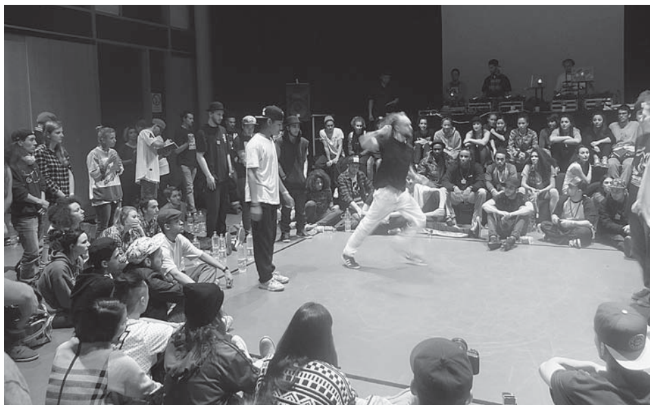
Tanzbattle in Stuttgart.

Redaktionsschluss für die nächste Ausgabe ist der 25. März 2015