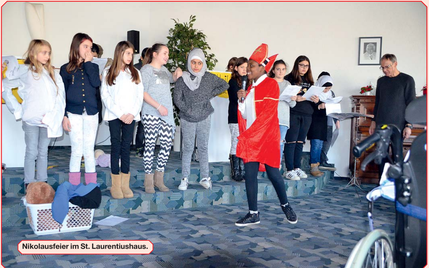
Nikolausfeier im St. Laurentiushaus.

Text: Petra Hercher