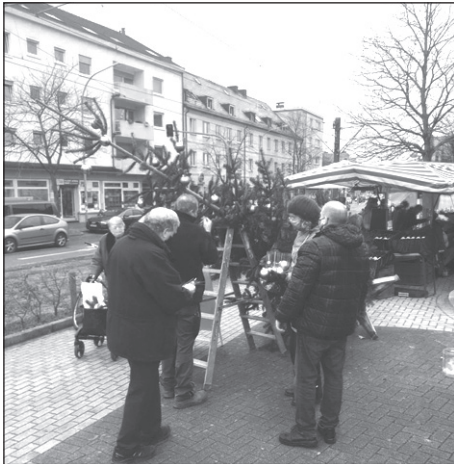
Die Marktbesucher beim Aufstellen des Weihnachtsbaums.